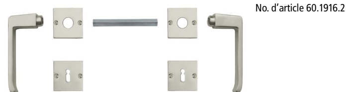
Tige Hager Duroquick® No. d'article 60.1916.2