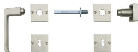
Tige «Wechsel» Hager Duroquick® No. d'article 60.1916.5 pour la fixation du bouton sur la rosace