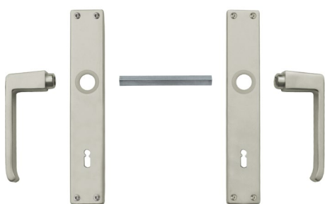
Tige Hager Duroquick® No. d'article 60.1916.2