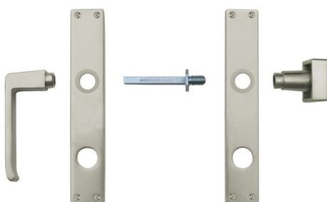
Tige «Wechsel» Hager Duroquick® No. d'article 60.1916.5 pour la fixation du bouton sur l'entrée