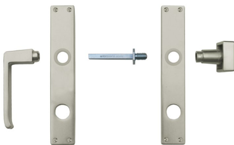
Wechselstift Hager DUROQUICK® Artikel-Nr. 60.1916.5 zum Fixieren von Türkнопfen auf Lang- schildern