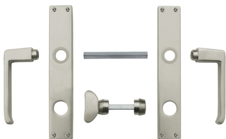
WC-Riegel mit Notöffner passend auf Langschilder mit RZ-Lochung