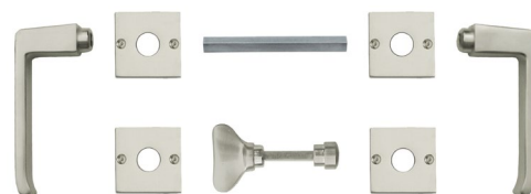
WC-Riegel mit Notöffner passend auf Drückerrosetten