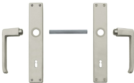
Verbindungsstift Hager DUROQUICK® Artikel-Nr. 60.1916.2