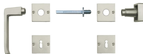
Wechselstift Hager DUROQUICK® Artikel-Nr. 60.1916.5 zum Fixieren von Tür- kнопfen auf Rosetten